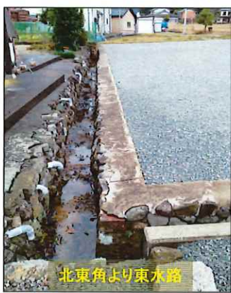
北東角より東水路