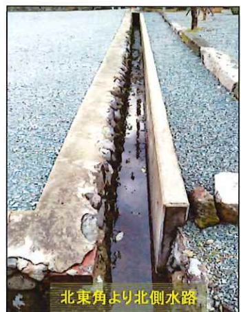
北東角より北側水路