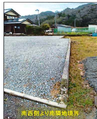
南西側より南隣地境界